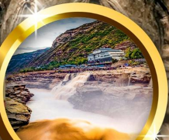
น้ำตกหูโข่ว