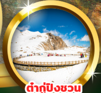
ต่ากู่ปิงชว่น