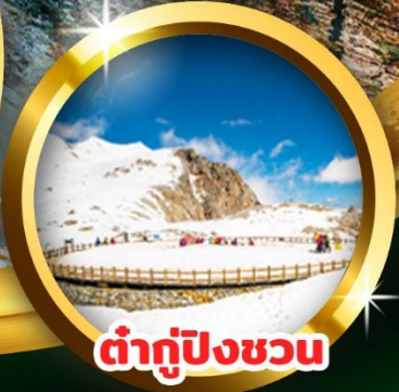
ต่ากู่ปิงชวณ