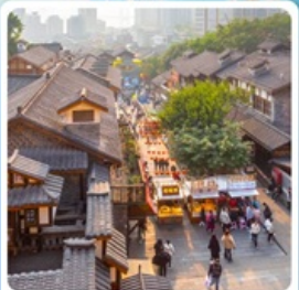
ถนนคนเดินสี่ปาตี้