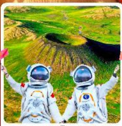
อุทยานภูเขาไฟอุลันฮาตา