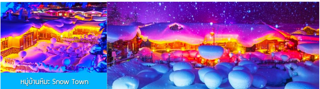
หมู่บ้านหิมะ Snow Town

ท่ามกลางท้องทุ่งและผืนป่าที่ปกคลุมด้วยหิมะราวกับอยู่ในโลกแห่งเทพนิยาย ผ่านหมู่บ้าน เวยหูจ้าย 威虎寨 ที่อดีตเคยเป็นที่ตั้งของรังโจรที่มักออกปล้นสะดมชาวบ้าน ม้าลากเลื่อนเป็นยานพาหนะเฉพาะพื้นที่ ๆ ที่นิยมนำมาใช้ในการเดินทางหรือลำเลียงสิ่งของในช่วงฤดูหนาว ที่ใช้ม้ามาลากจูงแคร่เลื่อนให้สามารถเคลื่อนย้ายบนลานหิมะได้