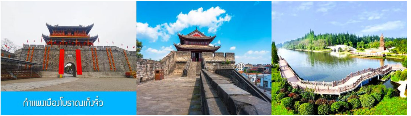
กำแพงเมืองโบราณเกิ่งจิว