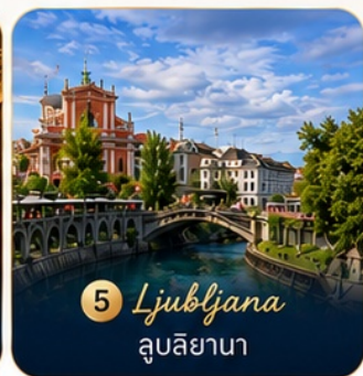
5 Ljubljana ลูบลียานา