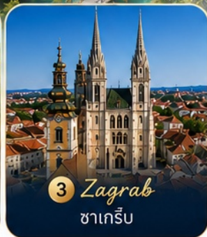
3 Zagreb ซาเกร็บ