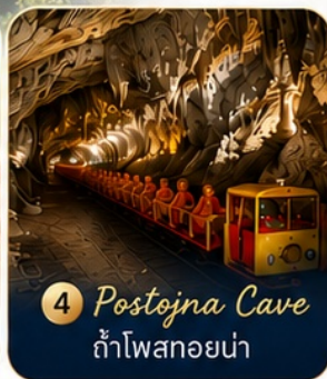
4 Postojna Cave ถ้ำโพสทอยน่า