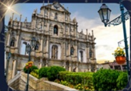
โบสถ์เซนต์ดอมิง