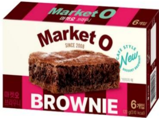
Market O Real Brownie (20g x 6cookie)