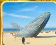
ประมาติกรรมวาฬไทยตัน