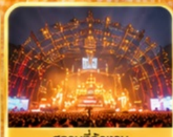
สถานที่จัดงาน เทศกาลเบียร์ชิงเต่า