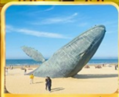
ประมาติกรรมวาฬเกยตื้น