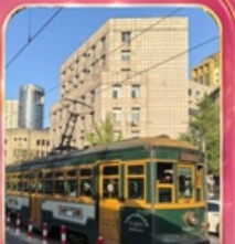
บั้งรถรางไฟฟ้าชมเมือง