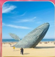
ประติมากรรม "วาฬผู้โดดเดี่ยว"