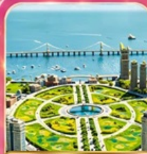
จัตุรัสซิงไห่