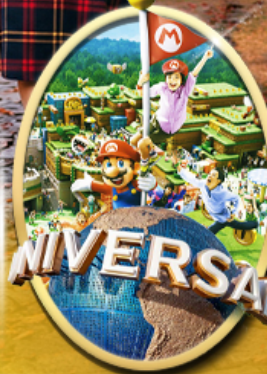
อิสระเลือกซื้อบัตร Universal Studios Japan