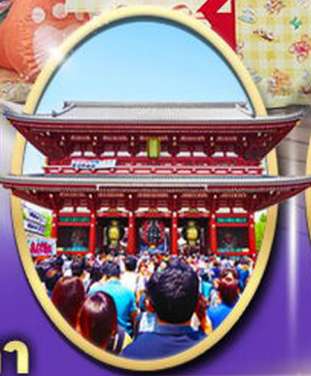
วัตเกาะซากุระ