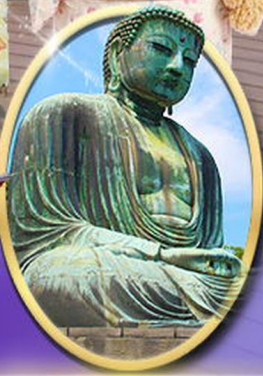
พระใหญ่คามาคูระ