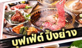
บุฟเฟ่ต์ ปิ้งย่าง