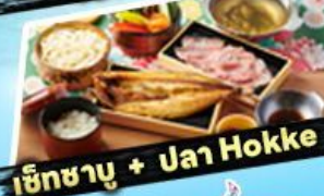
เซ็ทซาบู + ปลา Hokke

ราคา เริ่มต้น 36,919 บาท รวมภาษีมูลค่าเพิ่ม 7%