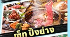
เช็ก บิงย่าง