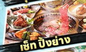
เซ็ท ปิงย่าง