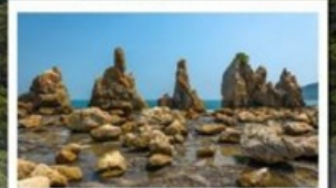
ชายหาดหินอาซึกุอิวะ

🧳 โหลด 23 KG. x2 ( รวม 46 KG. ) ทั้งไป - กลับ