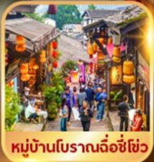
หมู่บ้านโบราณฉือชี่ฮั่ว