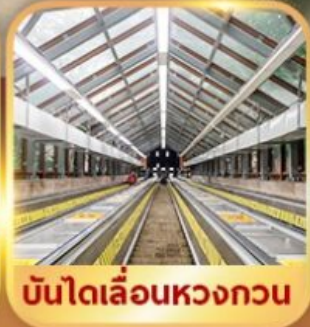
บันไดเลื่อนหวงกวน