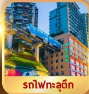
รถไฟฟ้าลัดติง