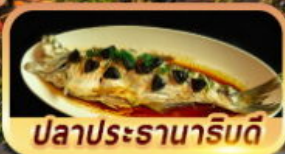
ปลาประรานาริมดี