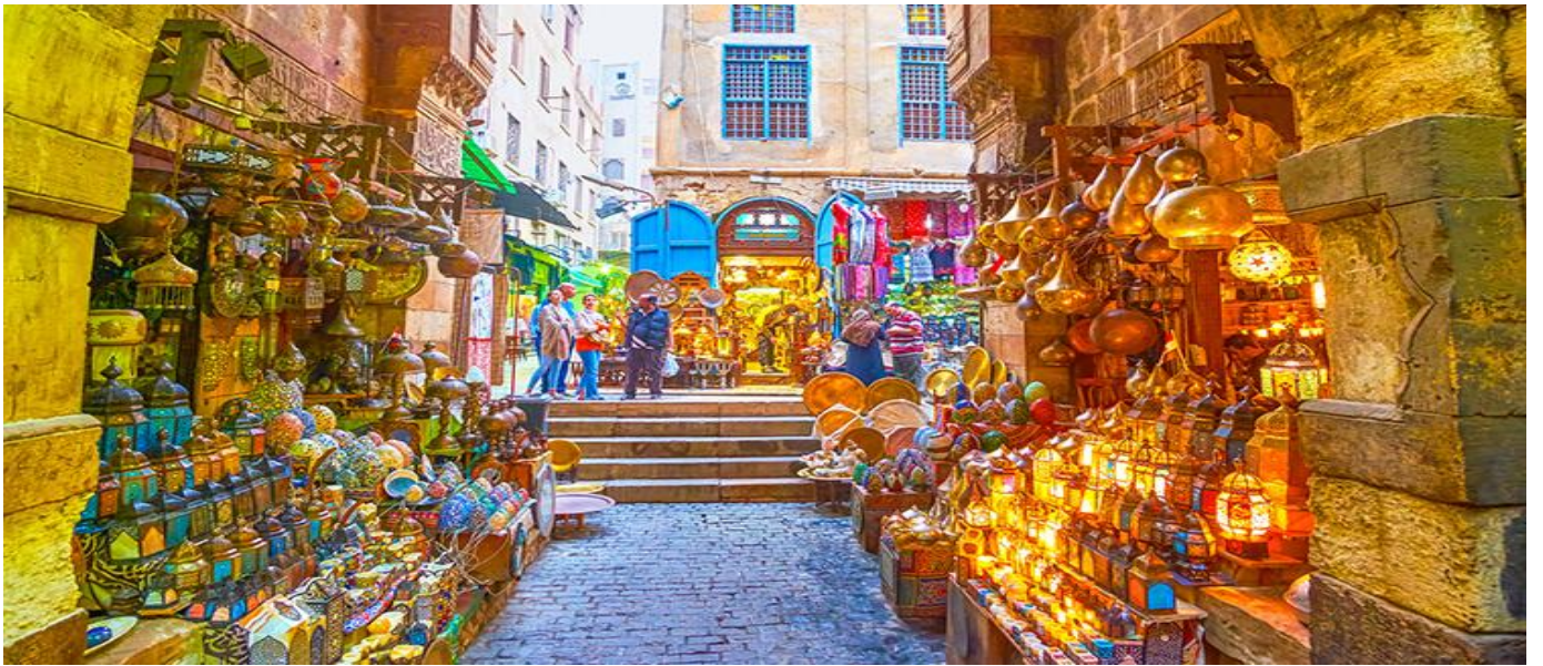
คำ บริหารอาหารเย็น ณ ภัตตาคารท้องถิ่น ถึงเวลาอันสมควรนำท่านขึ้นรถบัสปรับอากาศออกเดินทางสู่สนามบินไคโร

จากนั้นนำท่านเดินทางสู่ ตลาดข่านเอลคาลิลี (KHAN EL KHALILI) ตลาดข่าน เอล คาลิลี (KHAN EL KHALILI BAZAAR ) ประเทศอียิปต์ เป็นตลาดสไตล์อาหรับโบราณ อายุกว่า 600 ปี ถูกสร้างขึ้นครั้งแรกในช่วงปลายศตวรรษที่ 14 (ค.ศ. 1382-1389) โดย Jaharkas al-Khalili เดิมทีพื้นที่ตรงนี้เป็นสุสานของราชวงศ์ฟาติมิด ต่อมาได้มีการเคลื่อนย้ายกระดูกและสร้างอาคารพาณิชย์ขึ้น ตลาดขายของพื้นเมืองและสินค้าที่ระลึกที่ใหญ่ที่สุดในกรุง ไคโร ท่านสามารถเลือกซื้อของพื้นเมืองสวยๆ มากมาย ไม่ว่าจะเป็นขวดน้ำหอมที่ทำด้วยมือ สินค้าต่างๆ เครื่องทองรูปพรรณ และเพชรพลอย ลวดลายแบบอาหรับ พรหม และของที่ระลึกพื้นเมืองต่างๆ