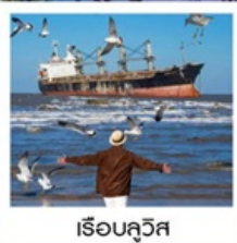
เรือบลูวิส