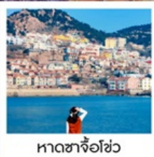
หาดซาจื่อฮั่ว