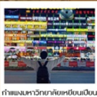
กำแพงมหาวิทยาลัยเหยียนเปียน