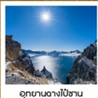
อุทยานอางโป่ซาน