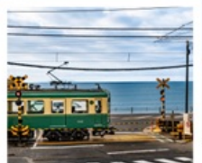
รถไฟเอโนะเด็น