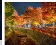
อุโมงค์เมบิล