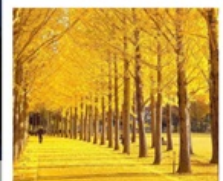
สวนเอ็งชิโงะ