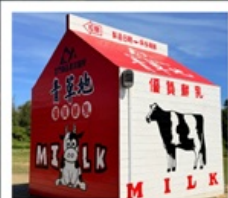
ฟาร์มโคนมจินเหมิน