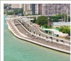
สะพานเหยียนหวู่เจียว

1 ประเทศ 2 ระบบ ในทริปเดียว!! ข้ามทะเลจากจีน...สู่จินเหมิน (ไต้หวัน)