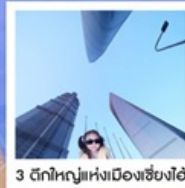
3 ด็กใหญ่แห่งเมืองเซียงไฮ้