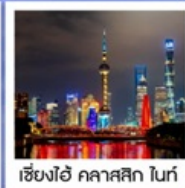
เซียงไฮ้ คลาสสิก ไทท์