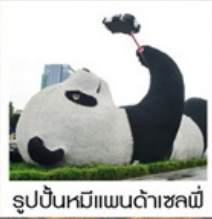
รูปปั้นหมีแพนด้าชหลี่