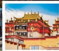
วัดชงจันหลิง