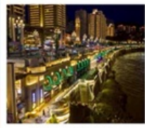
ถนนหนานปิ่น