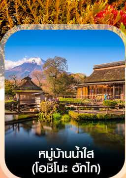
หมู่บ้านน้ำใส (โอฮิโนะ อักโก)

เช็किनเจแปน สัมผัสบรรยากาศใบไม้เปลี่ยนสี คามิโคจิ ชมเม้าท์ฟูจิ ณ ทะเลสาบคาวากุจิโกะ เดินเล่นเมืองเก่าคาวาโกเอะ ช้อปปิ้งชินจูกุ เกี้ยวเต็มไม่มีอิสระ พักโรงแรมออนเซ็น