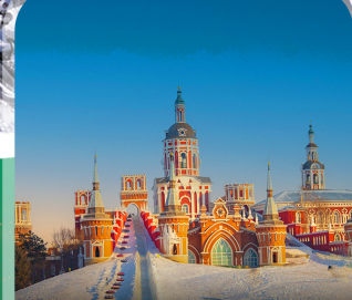
คฤหาสน์วอลก้า