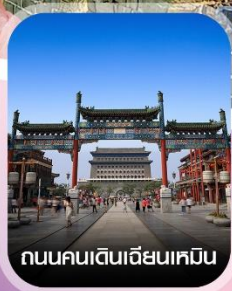
ถนนคนเดินเฉียนเหมิน

✈️ คอนเฟิร์มออกเดินทาง ทุกพีเรียด 2 ท่านขึ้นไป