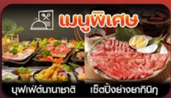
เมนูพิเศษ บุฟเฟ่ต์นาซาชิ เซ็ตปังย่างยากินุกุ

ฟุกุโอกะ-วัดนินโซอิน-หมู่บ้านยูฟูอิน-แบบบุ-บ่อนรกจิกุ-แช่ออนเซ็น-ช้อบปังเทนจิน-พักใกล้แหล่งช้อบปัง2คืน