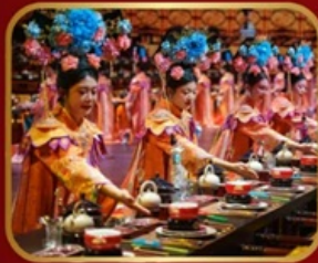
กัศดาการวังหลวง YU XIAN DU