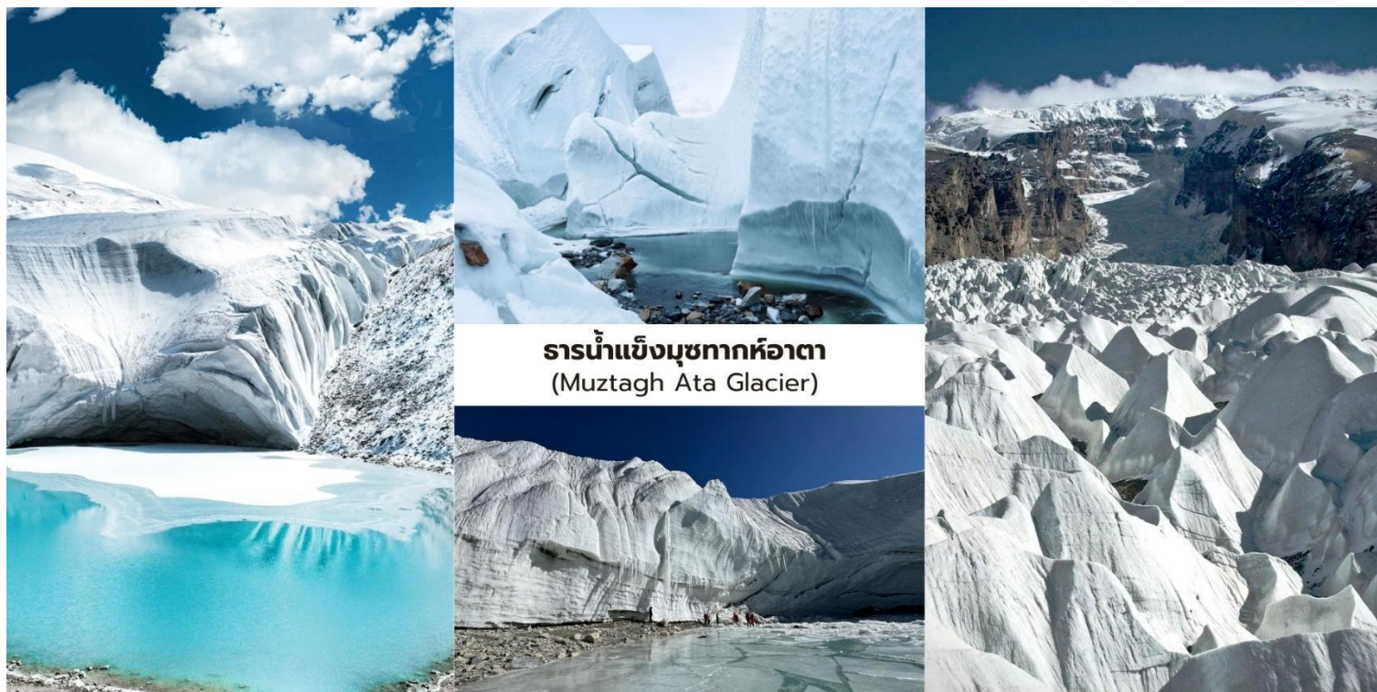
ธารน้ำแข็งมุขทากหืออาตา (Muztagh Ata Glacier)

นักท่องเที่ยวจะได้ โดยสารรถกอล์ฟไฟฟ้าของอุทยาน (รวมในรายการ) ลัดเลาะเข้าไปยังบริเวณเชิงเขาเพื่อชม ธารน้ำแข็งขนาดใหญ่ ที่ไหลลงมาจากยอดเขา ท่ามกลางทัศนียภาพของภูเขาหิมะและทุ่งน้ำแข็งที่ทอดยาวสุดสายตาให้ความรู้สึกถึงความยิ่งใหญ่ของธรรมชาติบนที่ราบสูงปามีร์ระหว่างทางอาจพบกับจามรี (Yak) ที่อาศัยอยู่ในพื้นที่ธรรมชาติของที่ราบสูงรวมถึงทิวทัศน์ภูเขาหิมะที่สวยงามเหมาะสำหรับการถ่ายภาพและชมธรรมชาติอันบริสุทธิ์