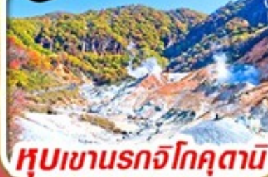
หุบเขานรกโจคุตานิ

รวม ค่าภาษีที่ปรับขึ้นแล้ว (ประกาศ 1 เม.ย. 69)