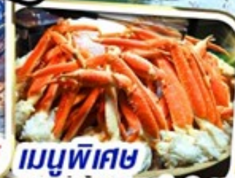
เมนูพิเศษ บุฟเฟ่ต์ชาบู 1 ชนิด