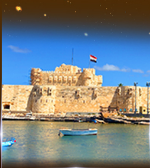
บ่อนปรการ Quite Bay