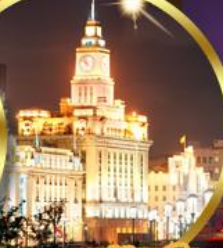
เดอะมันด์