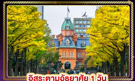
ฮิโรสะตามอริยาตัย 1 วัน

น้ำหนักกระเป๋า 20 Kg. บริการอาหาร บนเครื่อง ไป-กลับ