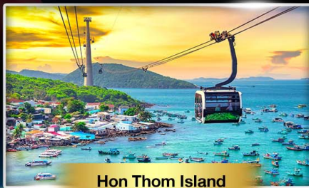
Hon Thon Island