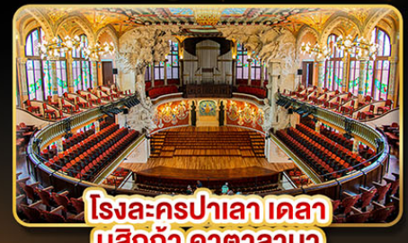
โรงละครปาเลา เดลา มูสิกา คาทาลานา