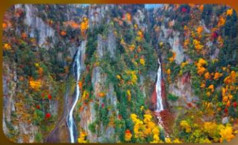
น้ำตกกิงกะ และน้ำตกริวเซ