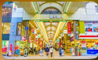
ซัปโปโระนาทูกิโจจิ