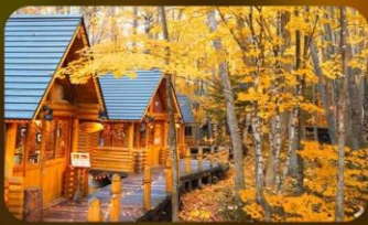
หมู่บ้านนิงเกิ้ลทอเรซ