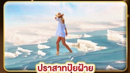
ปราสาทบิวเดีย