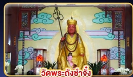
วัดพระถึงช้าง