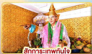
สักการะ-เทพทันใจ