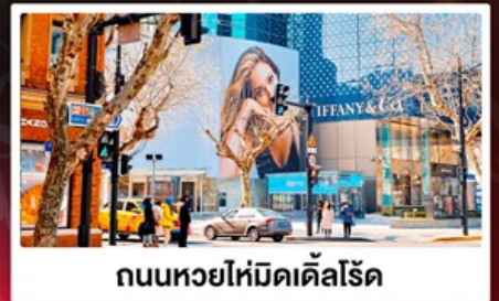
ถนนหอยให้มิดเดิ้ลไรด์