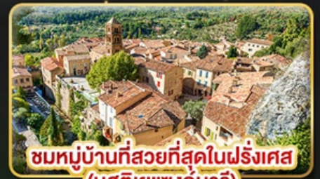
ชมหมู่บ้านที่สวยงามที่สุดในฝรั่งเศส (มูสติเยแซงก์มารี)