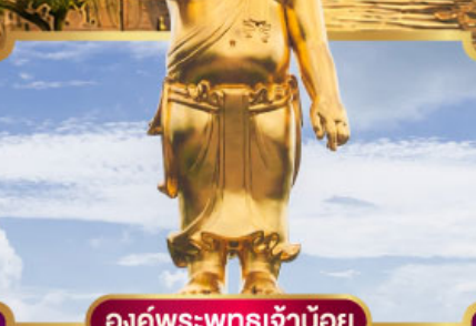
องค์พระพุทธรเจ้าน้อย