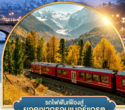
รถไฟพินเฟิงส์ ยอดเขากรอนเนอร์เกรต