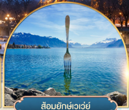
ล้อมยักซ์เวอว์