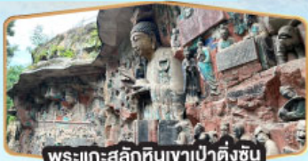
พระแกะสลักหินเขาเป่าต้งซัน