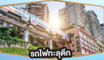
รถไฟฟ้าชุนชิ่ง