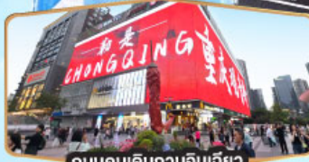
ถนนคนเดินทงหยวนเฉียว