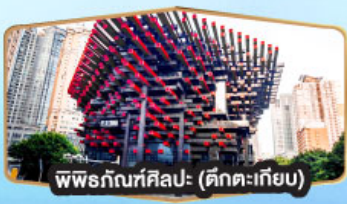
พิพิธภัณฑ์ศิลปะ (ศิลปะเก๋)