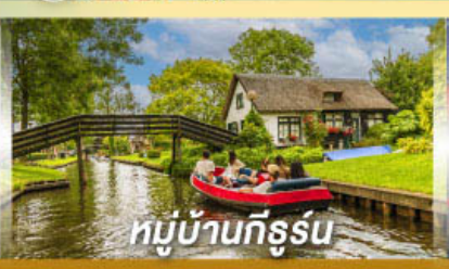
หมู่บ้านทีร์รูน