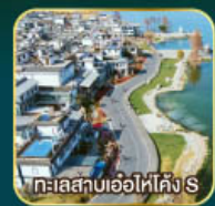
ทะเลสาบเอ้อไห่โค้ง S